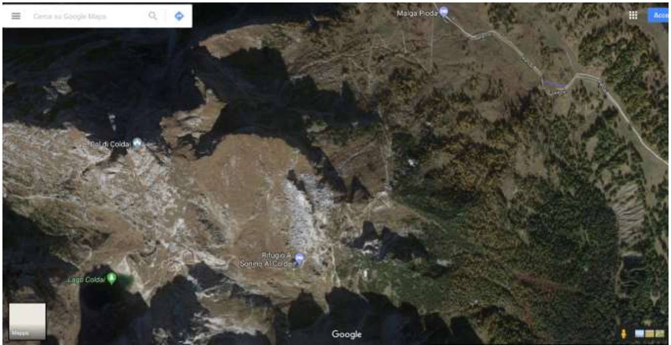
Veduta satellitare del sentiero che va a Malga Pioda – Rifugio Coldai e Lago Coldai