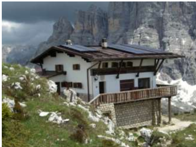
Foto aerea del Gruppo del Civetta e il Rifugio Tissi