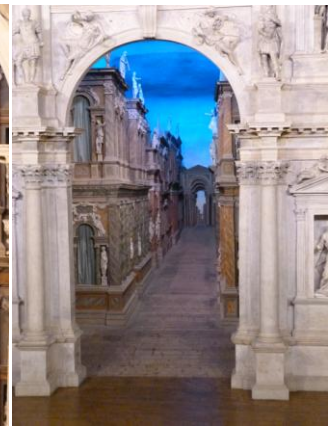
10-03-2013 Vicenza - Teatro Olimpico