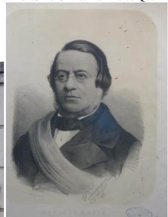
10-03-2013 Vicenza - Museo del Risorgimento