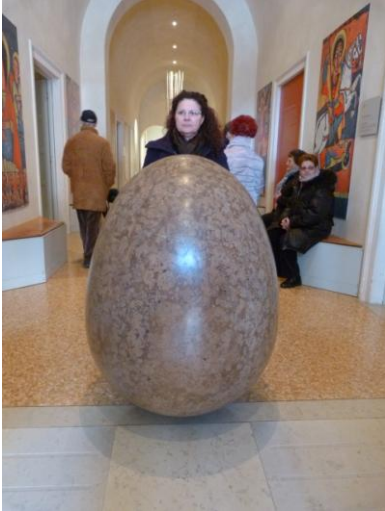
10-03-2013 Vicenza - Museo Diocesano