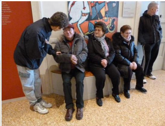
10-03-2013 Vicenza - Museo Diocesano