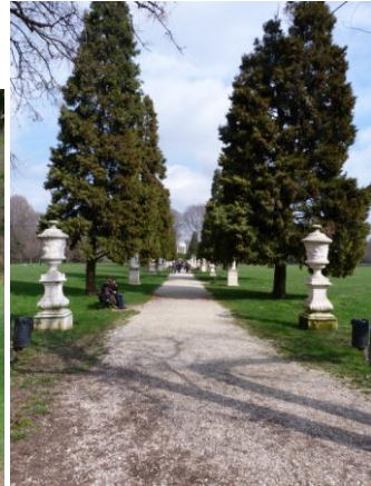
10-03-2013 Vicenza - Parco Querini