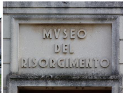
10-03-2013 Vicenza - Museo del Risorgimento