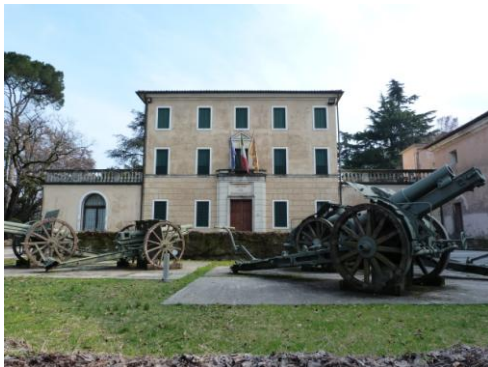
10-03-2013 Vicenza – Museo del Risorgimento