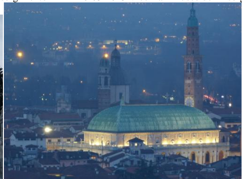
10-03-2013 Vicenza – Basilica Palladiana