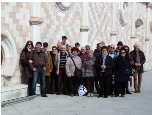
10-03-2013 Vicenza - Basilica