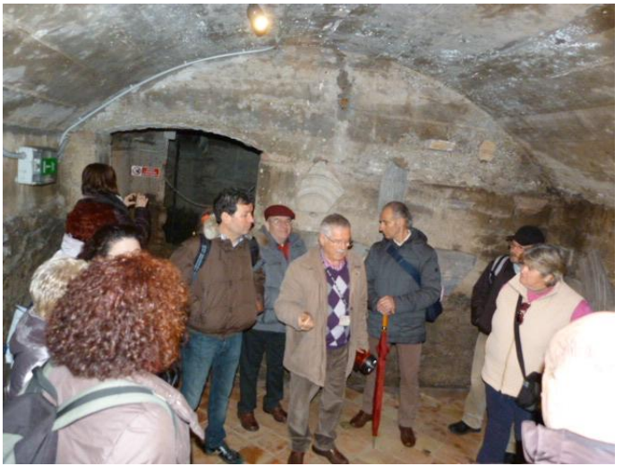
10-03-2013 Vicenza - Criptoportico Romano