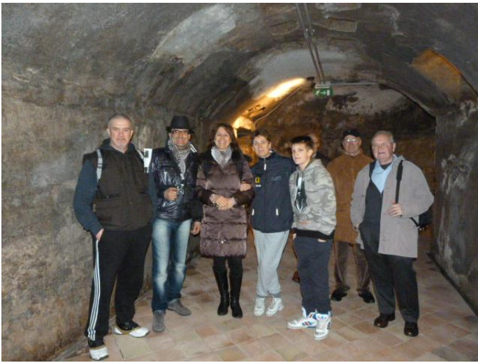
10-03-2013 Vicenza - Criptoportico Romano