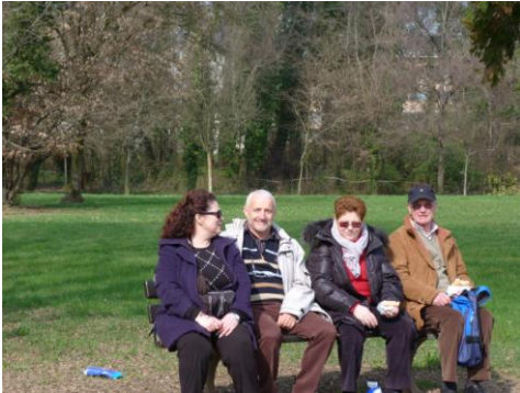
10-03-2013 Vicenza – Parco Querini