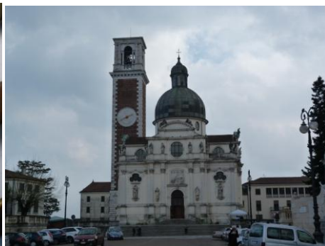
10-03-2013 Vicenza – Basilica Monte Berico