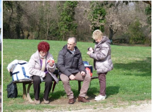
10-03-2013 Vicenza - Parco Querini