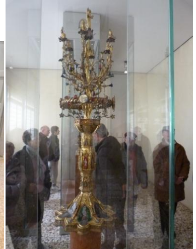
10-03-2013 Vicenza - Museo Diocesano