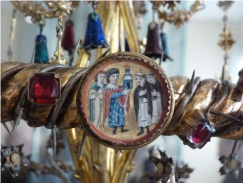
10-03-2013 Vicenza - Museo Diocesano