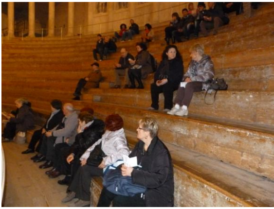
10-03-2013 Vicenza – Teatro Olimpico