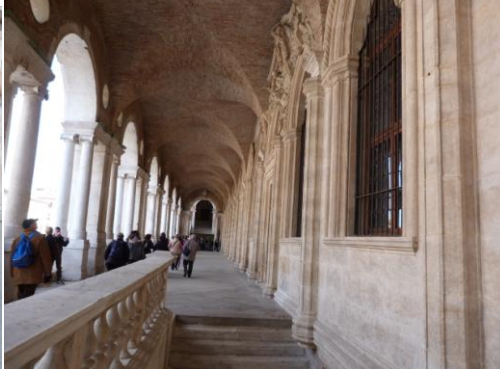
10-03-2013 Vicenza - Basilica