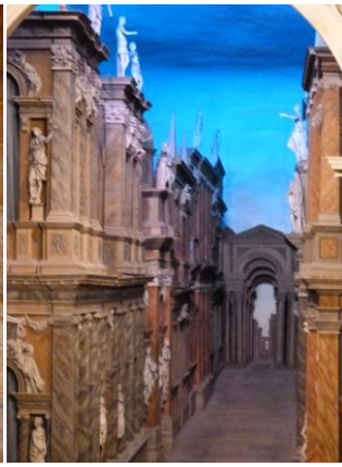
10-03-2013 Vicenza - Teatro Olimpico