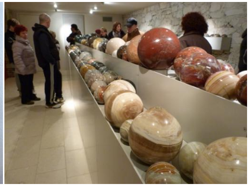
10-03-2013 Vicenza - Museo Diocesano