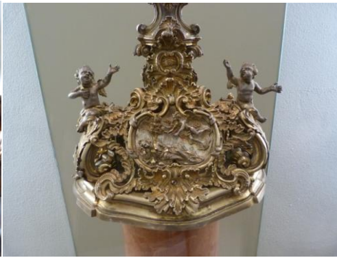
10-03-2013 Vicenza - Museo Diocesano