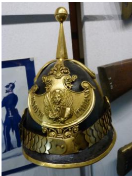
10-03-2013 Vicenza – Museo del Risorgimento