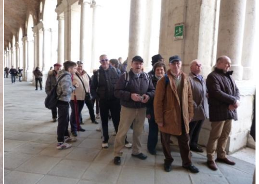
10-03-2013 Vicenza - Basilica