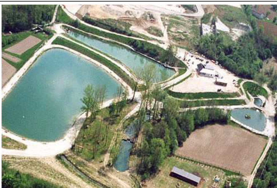
Veduta aerea. Laghetti Agriturismo RIO CAVALLI

info@galvancenter.it www.galvancenter.it