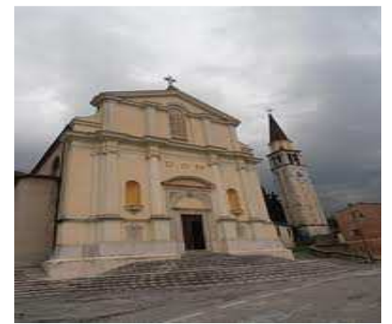
Chiesa, dietro all'altare si trova la pala di Jacopo da Ponte