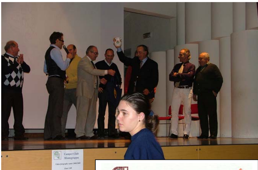
Camper Club Montegrappa Foto fotografata anno 2008/2009 Foto 1/06

PEDEMA ALLARMI-AUTOMAZIONI.IMPIANTI PeDeMa s.n.c. Via A. Ferrarin n°6/A 36050 Bolzano Vic.no (VI) Tel 0444-351676 fax 0444-354748 www.pedemaimpianti.com